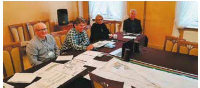
Spotkanie konsultacyjne online z projektantem nadnoteckich bulwarów

We wrześniu 2019r. podpisano umowę z wykonawcą zadania pn. „Nadnoteckie Bulwary w Wieleniu”, które stanowi część projektu „Rewitalizacja Wielenia szansą rozwoju Gminy”. Zadanie „Nadnoteckie Bulwary w Wieleniu” realizowane jest w formule „zaprojektuj i wybuduj”. Wykonawca, z którym podpisana została umowa opracowuje dokumentację projektową na bazie, której będą realizowane roboty budowlane.