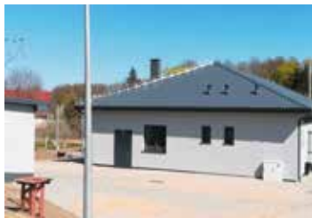
Sala wiejska we Wrzeszczynie w trakcie prac

Wkrótce zakończone zostanie zadanie związane z przebudową sali wiejskiej we Wrzeszczynie. Obiekt służący społeczności wiejskiej, z uwagi na zły stan techniczny, został wyłączony z eksploatacji w roku 2018. Opracowany został