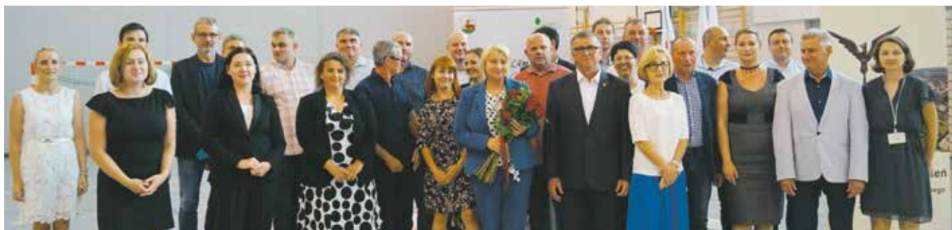
XV Sesja Rady Miejskiej w Wieleniu, 26.06.2020 r. w Hali Sportowo- Widowiskowej w Wieleniu

Ważny moment dla samorządu! Podczas sesji Rady Miejskiej w Wieleniu, która odbyła się 26 czerwca 2020 r. wieleńscy radni po raz kolejny opowiedzieli się za udzieleniem absolutorium dla Burmistrza Wielenia.