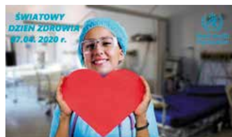
Gminny Konkurs Plastyczny Online pt. „Kartka dla cichego bohatera” zaprosza Miejsko - Gminny Ośrodek Kultury w Wieleniu i Gminne Przedszkole w Wieleniu

Konkurs z okazji Światowego Dnia Zdrowia (07.04.2020 r.). Organizatorzy: Miejsko-Gminny Ośrodek Kultury, Gminne Przedszkole w Wieleniu. Konkurs stał się akcją społeczną. Prace były wywieszane w oknach jako podziękowanie za trud ciężkiej i niebezpiecznej pracy służ medycznych i ratunkowych w czasie pandemii.