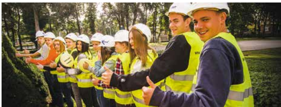
Jest dofinansowanie zewnętrzne na kształcenie zawodowe młodzieży w Zespole Szkół w Wieleń

„Kompleksowy program rozwoju kształcenia zawodowego Technikum im. hetmana Stefana Czarnieckiego w Wieleń” to kolejny program edukacyjny który będzie realizowany przez Gminę Wieleń dzięki wsparciu Wielkopolskiego Regionalnego Programu Operacyjnego 2014-2020 w ramach Działania 8.3 Wzmocnienie oraz dostosowanie kształcenia i szkolenia zawodowego do potrzeb rynku pracy Poddziałanie 8.3.1 Kształcenie zawodowe młodzieży – tryb konkursowy. Całkowity koszt projektu złożonego przez Gminę Wieleń to kwota 914.709,03 zł, z czego przyznane dofinansowanie wynosi 823.238,12 zł. Projekt będzie realizowany od czerwca 2020 roku do końca lutego 2022r. Dzięki pozyskanym środkom zostanie wzbogacona infrastruktura edukacyjna dla uczniów kształcących się w zawodach technik informatyk i logistyk. W ramach projektu powstanie nowoczesna pracownia języków obcych, do której zostanie zakupiony system do nauczania języków, 16 zestawów komputerowych oraz telewizor interaktywny. Pracownia informatyczna zostanie wyposażona w nowy sprzęt komputerowy, aparat fotograficzny, monitor interaktywny, drukarkę, tablety graficzne