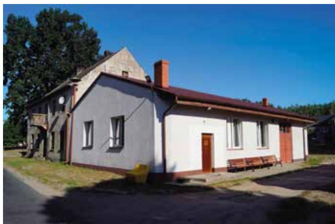
Sala wiejska w Folsztynie przed remontem