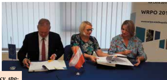
Podpisanie umowy o dofinansowanie projektu „Program aktywnej integracji w Gminie Wieleń”

Miejsko-Gminny Ośrodek Pomocy społecznej w Wieleniu w ramach współpracy z Bankiem żywności objął pomocą żywnościową większą liczbę beneficjentów! Liczba osób korzystających wzrosła ze 100 do 1675.