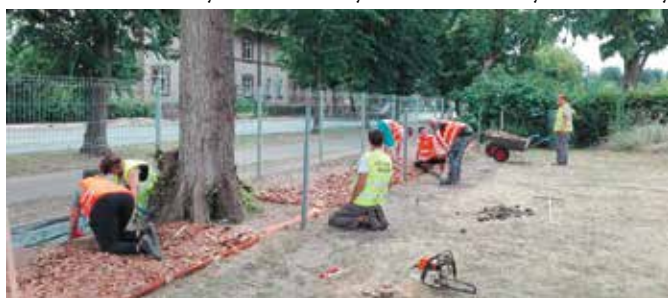
Uczestnicy CIS „Arka” w Wieleniu podczas pracy.