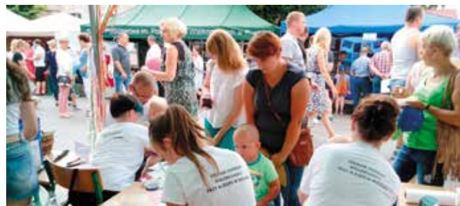
Lokalne Centrum Wolontariatu.

W 2016 roku została również podjęta uchwała o utworzeniu Centrum Integracji Społecznej na terenie Gminy Wielień, jako Samorządowego Zakładu Budżetowego. W 2017 roku została powołana zarządzeniem Burmistrza Wielenia Komisja do utworzenia CIS. W marcu 2017 roku przeprowadzono diagnozę problemów społeczno-gospodarczych na terenie Gminy Wielień. W ramach prac komisji w czerwcu 2017 roku został złożony wniosek do Wojewody o nadanie CIS, a następnie do Urzędu Marszałkowskiego o przyznanie dotacji na rozpoczęcie działalności CIS, dzięki czemu udało się pozyskać około 600 tys. zł.