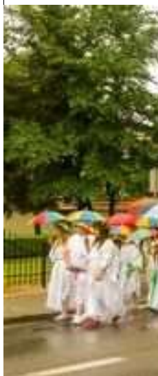
Rewitalizacja. Happening. Wieleń, 04.06.2017

23.07.2017 podczas Dni Ziemi Wieleńskiej.