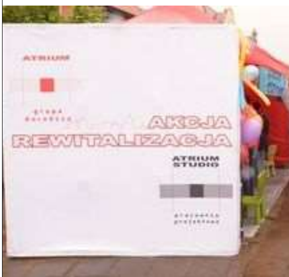
Stoisko - Konsultacje z mieszkańcami. Wieleń, 04.06.2017