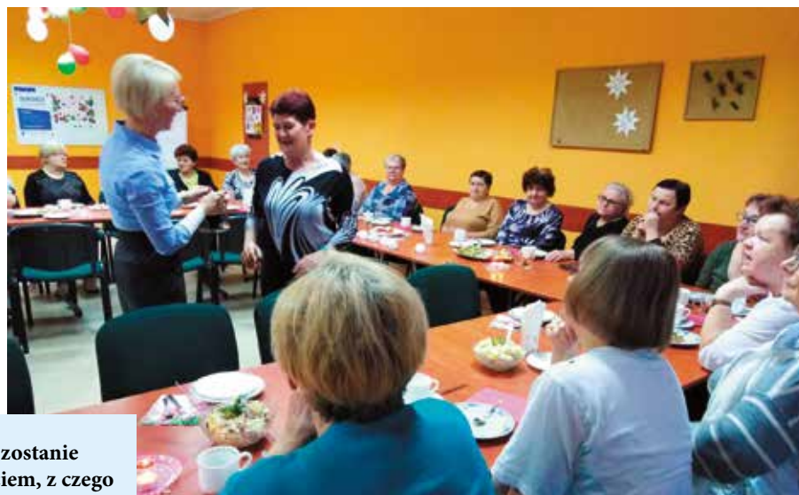
Uczestniczki Klubu Seniora z Osiedla Północnego wzięły udział w warsztatach wizażu z okazji Dnia Kobiet.

wany system GPS, co pozwoli szybko zlokalizować miejsce przebywania osoby potrzebującej pomocy. Utworzona zostanie wypożyczalnia sprzętu rehabilitacyjnego, w której znajdą się m.in. rotor rehabilitacyjny, łóżka rehabilitacyjne, wózki inwalidzkie, kule czy laski.