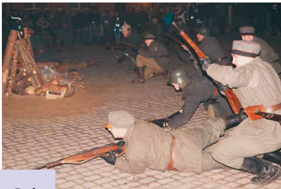
W rolę powstańców wcielili się m.in. mieszkańcy gminy Wieleń

dziła Szkoła Podstawowa im. Powstańców Wielkopolskich. Wydarzenie zbiegło się z 100. rocznicą walk powstańczych o Miały, jak również 60. rocznicą nadania szkole imienia Powstańców Wielkopolskich. Po