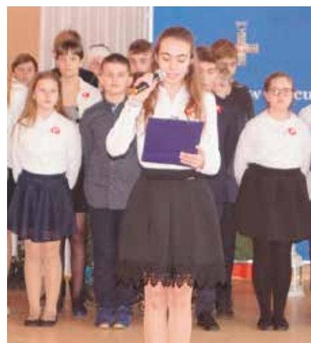
W Miałach ważnym elementem uroczystości była akademia

Także w Miałach pamiętano o powstaniu. 11 stycznia br. święto patrona obcho-