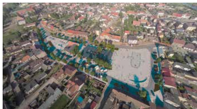
Teren placu przy ul. Nowe Miasto - obszar rewitalizowany

Operacja pn. „Rewitalizacja Wieleń szansą rozwoju Gminy” uplasowała się na szóstym miejscu listy rankingowej projektów wybranych dofinansowania. Kwota pozyskanego dofinansowania to: 16.542.035,10 zł, co stanowi 85% kosztów kwalifikowalnych projektu. Okres realizacji: 2019- 2020.