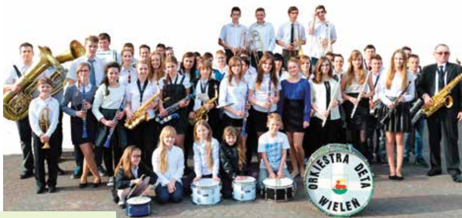
Zdjęcie Orkiestry Dętej zostało wykonane cztery lata temu. Od tego czasu skład osobowy znacząco się nie zmienił. Dzisiaj orkiestrę tworzy: 37 członków i kilkunastu uczących się.

Większość mieszkańców kojarzy orkiestrę z występów podczas najważniejszych wydarzeń w gminie Wielen i okolicach. To święta patriotyczne, dożynki, ale też Dni Ziemi Wieleńskiej. – Nasza orkiestra wrosła się w tkankę społeczną miasta i gminy – mówi