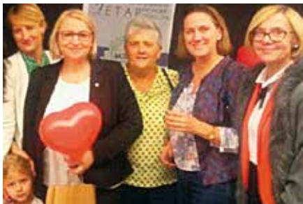
Reprezentacja Gminy Wielen - uczestniczki konferencji w Pile

Co to znaczy? Znaczy to tyle, że OBEZ prowadzi działalność gospodarczą, z której cały zysk przeznaczają na cele społeczne, działa też na rzecz promocji edukacji, zatrudniania i aktywizacji osób pozostających bez pracy bądź zagrożonych zwolnieniem z pracy.