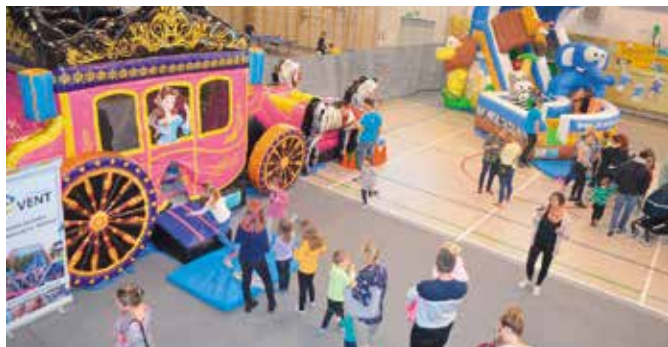
Feriada odjazdowa na Hali Sportowo-Widowskowej w Wieleniu

► Tegoroczna Feriada odbyła się pod hasłem "Ferie wesołe, bezpieczne i zdrowe".