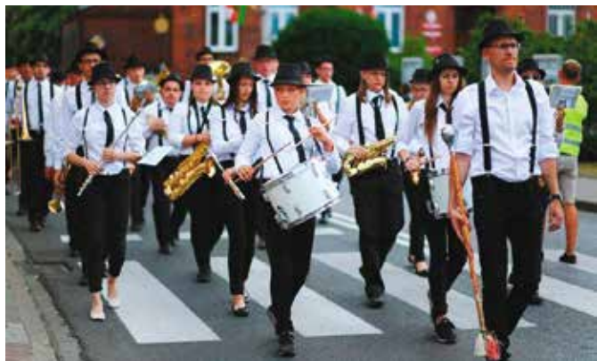
Mieszkańcy kochają orkiestrę z występów podczas najważniejszych wydarzeń w gminie.

Prezes wieleńskiej orkiestry podkreśla, iż w pewnym momencie nastąpiła zmiana mentalności w środowisku, zaczął funkcjonować inny sposób myślenia, być może to był istotny krok, aby uwierzyć, że jako orkiestra mogą działać na wielu polach i realizować nietuzinkowe projekty.