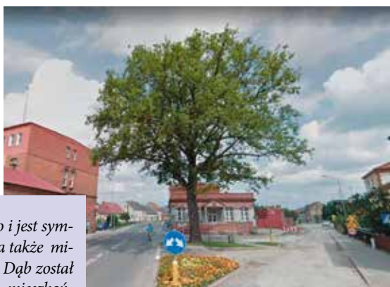
Wieleński dąb na skrzyżowaniu ul. Kościuszki, Staszica i Szkolnej w Wieleniu

Nasze drzewo było i jest symbolem polskości, a także miłości do Ojczyzny. Dąb został posadzony przez mieszkańców Wielenia w 1920 roku podczas uroczystości związanych z odzyskaniem niepodległości Wielenia.