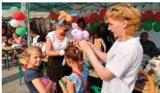
Wolontariusze biorą udział w różnych festynach

Głównym celem lokalnego centrum jest rozwój i propagowanie idei wolontariatu