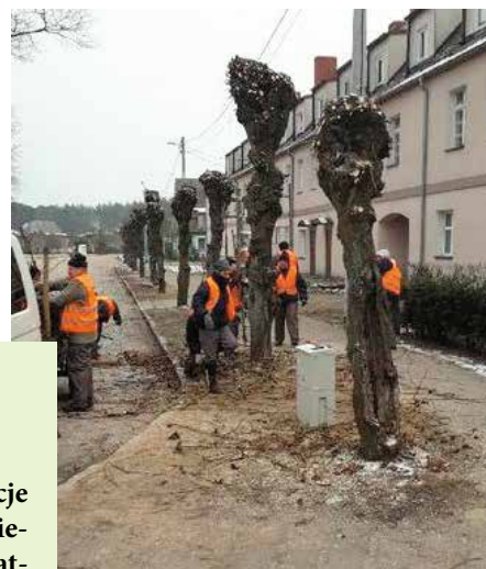
Pracownicy CIS-u podczas wykonywania prac porządkowych na terenie miasta Wielenia

Centrum Integracji Społecznej ARKA w Wieleniu zaprasza do kontaktu i korzystania z usług.