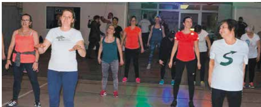
Panie cieszyły się z nietypowej formuły, którą przygotowano z okazji ich święta