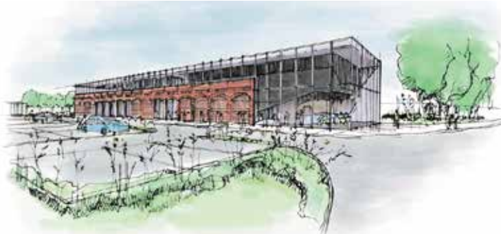
Centrum Multimedialne "Mediateka"

Uzupełnieniem zagospodarowania rewitalizowanego terenu będą inwestycje realizowane ze środków własnych Gminy Wieleń, tj. przebudowa ulicy Nowe Miasto (odcinek drogi o szerokości 4,0 m i długości 352 mb. o nawierzchni asfaltowej wraz z chodnikami i miejscami