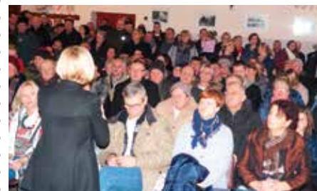
Zebrania były okazją do poruszania istotnych spraw dla lokalnej społeczności.

Coroczne spotkania władz samorządu wieleńskiego z mieszkańcami sołectw i osiedli są punktem obowiązkowym. Warto