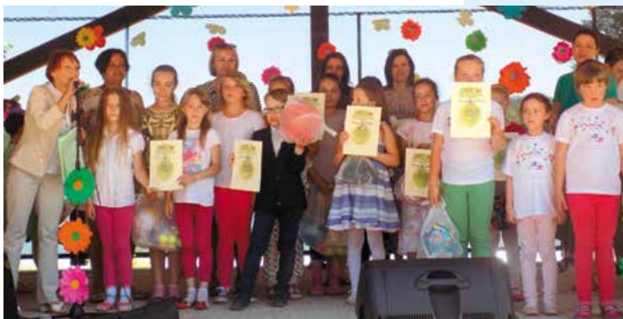
Na zdjęciu laureaci tegorocznego konkursu ekologicznego w Dzierżąźnie Wielkim

Powodem do dumy jest też zdobycie III miejsca w Wojewódzkim Konkursie Przyrodniczo – Łowieckim dla szkół podstawowych województwa