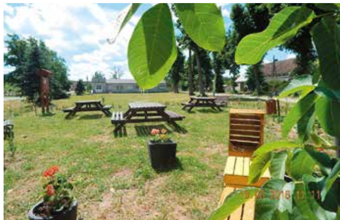
Ogród w Zielonowie jest przykładem dbałości o wspólną przestrzeń

przez skoszenie trawy we własnym zakresie, aby eliminować miejsca, za które dziś trochę nam wstyd. Mam jednak świadomość, że możemy Państwa tylko prosić o zaangażowanie, bowiem nasza gmina jest tak rozległa, że samorząd bez pomocy mieszkańców nie jest w stanie na bieżąco zadbać o wszystko.