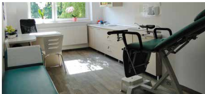
W Wieleniu powstał gabinet położnej z prawdziwego zdarzenia

W styczniu br. zgłosiła się do siedziby Administracji Budynków Komunalnych osoba, która była zdecydowana wynająć lokale przy ul. Jana Pawła II 27. Po podpisaniu przedwstępnej umowy najmu rozpoczęły się prace remontowe: dwóch gabinetów, korytarza oraz toalety. Kompleksowy remont przedmiotowych pomieszczeń trwał od stycznia do marca i zawierał m.in. remont instalacji elektrycznej wraz z wymianą i montażem osprzętu, w tym nowych lamp ledowych. Był też remont instalacji kanalizacyjnej poprzez wymianę pionów żeliwnych na PCV oraz remont instalacji wodnej wraz z uzupełnieniem osprzętu w postaci wylewek, umywalk i zlewni. Wymieniono stolarkę drzwiową oraz stare żeliwne grzejniki na grzejniki sanitarne, a pozostałą instalację w postaci rur zewnętrznych obudowano w celu zapewnienia czystości w lokalach. Wykonano remont posadzek, na których znalazły się nowe płytki podłogowe - równe we wszystkich pomieszczeniach. Sufity zostały podwieszane oraz przemalowane na kolor biały. Przy jednym z gabinetów powstała toaleta.