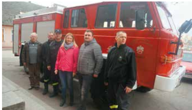
Star w drodze do Miałów zjechał pod Urząd Miejski w Wieleniu

Można dostrzec coraz lepszą współpracę pomiędzy gminnymi jednostkami OSP. Takie wnioski wysuwają się po czerwcowych wyborach władz Miej-