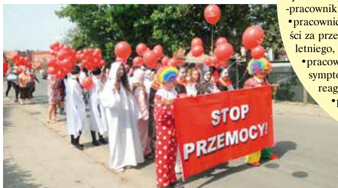
Akcja „Stop Przemocy” zakończyła się wspólnym przemarszem ulicami Wielenia

25 maja cała społeczność szkolna przybrała barwy miłości, a uczniowie, nauczyciele i goście zostali zaproszeni przez Panią Dyrektorkę Dolną do obejrzenia spektaklu profilaktycznego Tylko Mnie Kochaj. Na chwilę przenieśliśmy się do Krainy Dobra i Zła, Nieba – Ziemi, za których plecami czai się symboliczne Piekło. Ten metaforyczny świat unaoocnił nam codzienną walkę dobra ze złem, a przede wszystkim pokazał nadrzędną wartość – DZIECKO, o którego spokój i dobro powinniśmy walczyć niezależnie od wszystkich przeciwności losu. Następnie stworzyliśmy KOROWÓD MIŁOŚCI, wędrowaliśmy