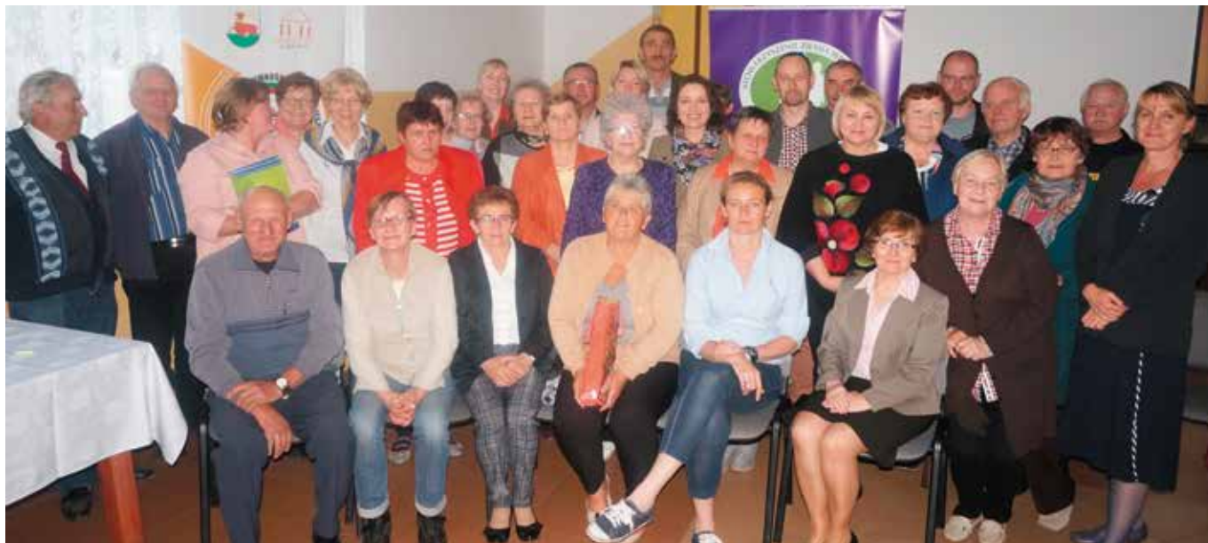
Uczestnicy Akademii Obywateli oraz mieszkańcy Zielonowa